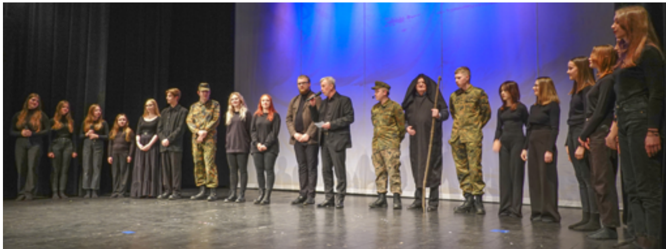
Młodzi aktorzy tuż po premierze przedstawienia

Owacją na stojąco nagrodzono premierę sztuki „Antyгона” w reżyserii Zbigniewa Pateraka. W rolę aktorów wcielił się amatorzy – uczniowie miejscowych szkół. Zagrali jak profesjonalści.