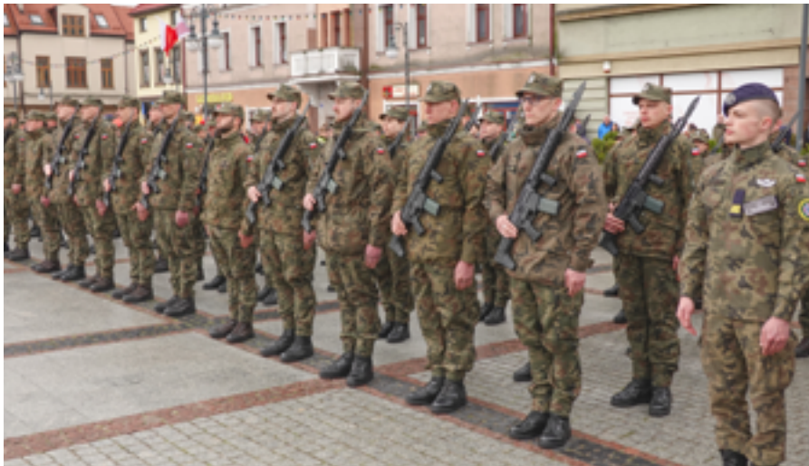
Żołnierze składający przysięgę

To było pierwsze takie wydarzenie w gminie. 1 kwietnia dziewięćdziesięciu żołnierzy złożyło uroczyste ślubowanie, wstępując w szeregi 11. Małopolskiej Brygady Obrony Terytorialnej.