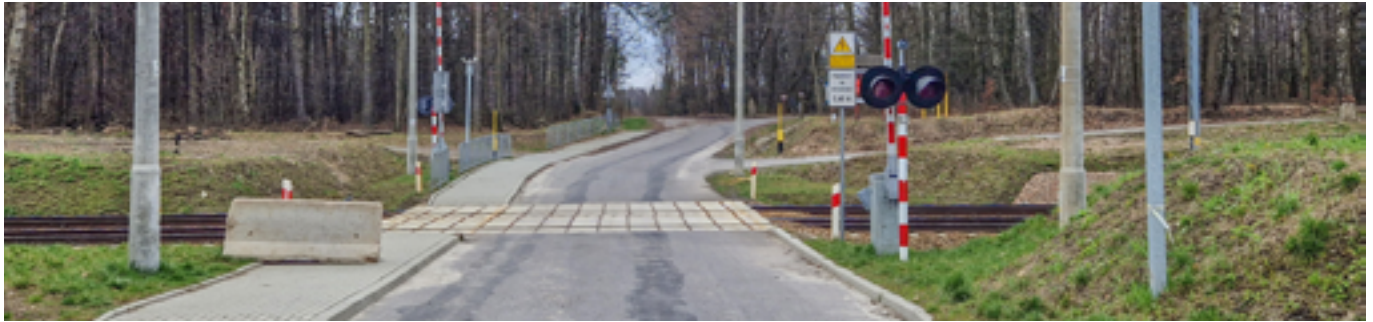
W miejscu obecnego przejazdu przez tory w ciągu ul. Tenczyńskiej w Dulowej powstanie przejście dla pieszych i rowerzystów