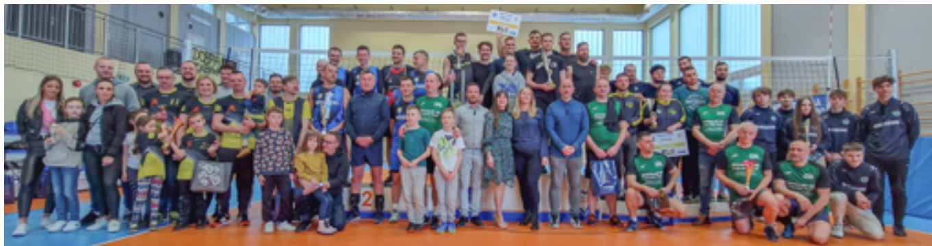
Uczestnicy drugiej edycji Trzebińskiej Ligi Siatkówki podczas wielkiego finału

Za nami druga edycja Trzebińskiej Ligi Siatkówki. O mistrzostwo walczyło dziewięć drużyn.