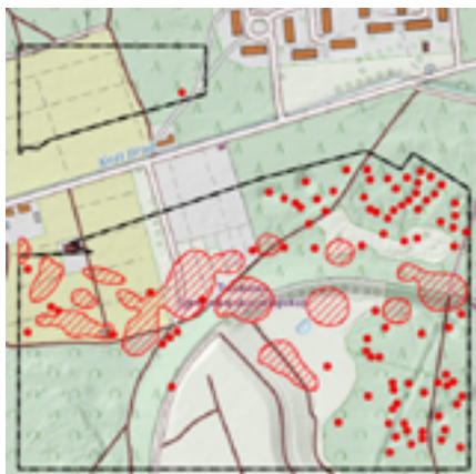
Fragm. interaktywnej mapy z wynikami badań służb geologicznych kraju.

Wstępny raport z przeprowadzonych badań w Trzebini, zleconych przez Głównego Geologa Kraju, wiceministra Piotra Dziadzio, opublikowało Centrum Geozagrożeń Państwowego Instytutu Geologicznego - Państwowego Instytutu Badawczego. Można się z nimi zapoznać na ich stronie internetowej www.pgi.gov.pl . Póki co, Państwowa Służba Geologiczna przebadła około 32 ha, m.in. cmentarz i jego sąsiedztwo. Badania będzie kontynuować.