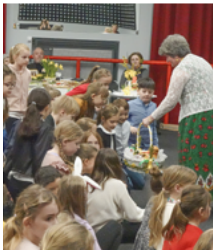
Panie z KGW przypomniały dzieciom, co należy włożyć do świątecznego koszyczka i który produkt, co symbolizuje

Panie z KGW przygotowały dziesiątki pysznych potraw – faszerowane jajka, sałatki, domowej roboty wędliny, żurek, śledzie, ciasta. Przypomniły też, co należy włożyć do koszyczka w Wielką Sobotę.