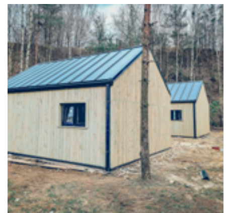
Trwają prace wykończeniowe w domach nad Balatonem

Ośrodek La Playa Resort&Camp to także popularna w sezonie restauracja. Jej ponowne otwarcie planowane jest już w kwietniu.