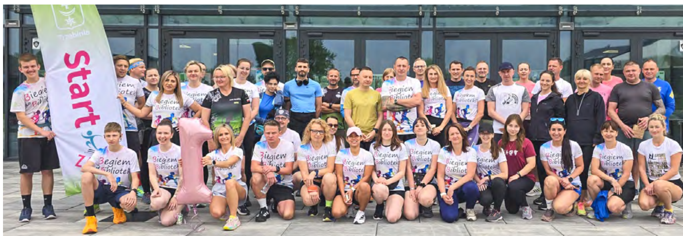
Grupa biegowa „Zaczytani Zabiegani” świętowała 1. urodziny

Rok temu było ich kilku. Dziś w każdą sobotę na starcie staje blisko 120 osób. „Zaczytani Zabiegani” właśnie świętowali swoje 1. urodziny – i wszystko wskazuje na to, że dopiero się rozkręcają!