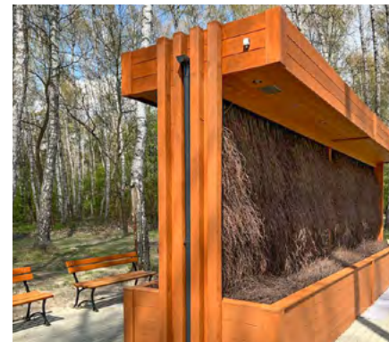
Tężnia nad Chechtem zaprasza

Tężnia nad Chechtem to pierwszy taki obiekt w gminie. Jeszcze w tym roku kolejny ma stanąć na osiedlu Siersza w Trzebini. Początkowo przymierzano się do jego uruchomienia w parku koło Willi NOT. Z uwagi na brak zgody konserwatora zabytków, zmieniono lokalizację. Tężnia stanie przy ul. Ogrodowej, obok placu zabaw i terenu rekreacyjnego.