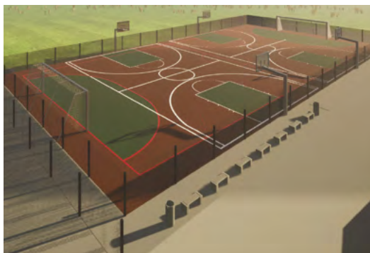
Wizualizacja wielofunkcyjnego boiska, jakie powstanie przy Szkole Podstawowej nr 3 na osiedlu Trzebionka. Autor wizualizacji: PRIMTECH Szymon Kita Tarnowskie Góry

- Przebudowa gminnej infrastruktury sportowej to jeden z podstawowych celów, jaki postawiłem sobie, ubiegając się