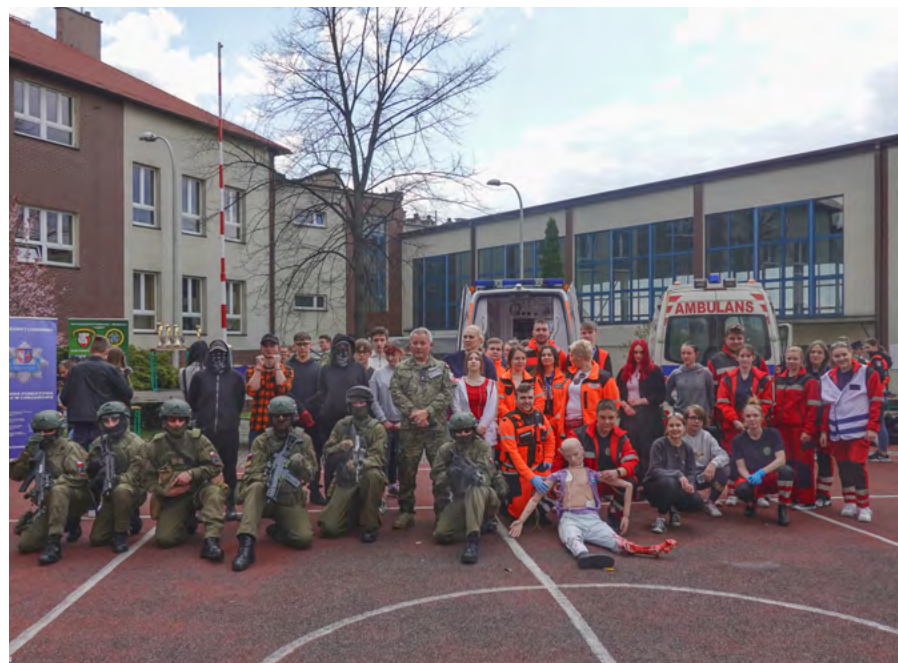
Uczestnicy i osoby odpowiadające za realizację pokazu

tariów. Społeczność szkoły przygotowała pokaz antyterrorystyczny, by w praktyce pokazać, czego uczą się na co dzień. Ten punkt programu podobał się najbardziej.