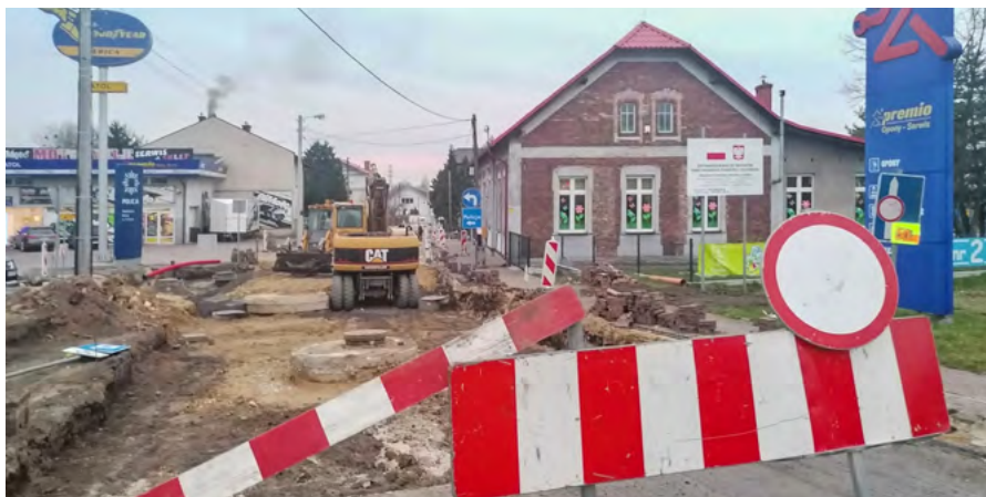
Remont ul. Ochronkowej potrwa do 31 maja

► W Dulowej ruszyła przebudowa ul. św. Floriana. To kolejny etap realizacji przedsięwzięcia. W ubiegłym roku nowa nawierzchnia pojawiła się na odcinku od skrzyżowania z drogą krajową nr 79 do skrzyżowania z ul. Kazimierza Wielkiego, a także na fragmencie ul. Brata Alberta (od skrzyżowania z ul. św. Floriana do przepustu na potoku Dulówka). Teraz drogowcy przebudowują odcinek od miejsca zakończenia I etapu. Koszt zadania to blisko 497 tys. zł.