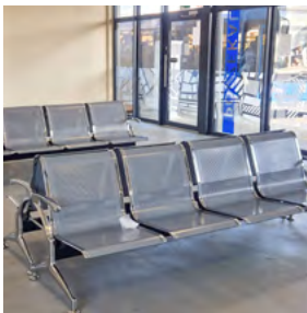
Poczekalnia na dworcu autobusowym

Zmieniły się godziny otwarcia poczekalni na dworcu autobusowym Węzeł Trzebinia. Wraz z nadejściem cieplejszych miesięcy, obiekt nie jest już dostępny przez całą dobę.