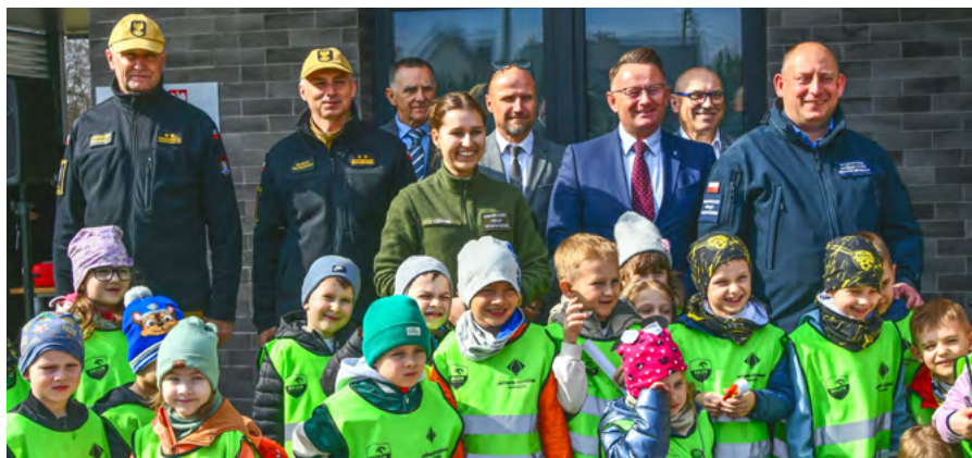
W uroczystym podsumowaniu działań z programu OLiOC uczestniczyli samorządowcy, przedstawiciele służb mundurowych. Zaproszono też dzieci z przedszkola nr 2, by pokazać im zakupiony sprzęt

Nowa cysterna na wodę pitną, agregaty prądotwórcze, pompy i namiot pneumatyczny – to tylko część sprzętu, który trafił do Trzebini w ramach Programu Ochrony Ludności i Obrony Cywilnej. W ubiegłym roku Gmina otrzymała na ten cel ponad 1,25 mln zł. Zakupy mają zwiększyć bezpieczeństwo mieszkańców i usprawnić działania służb w sytuacjach kryzysowych.