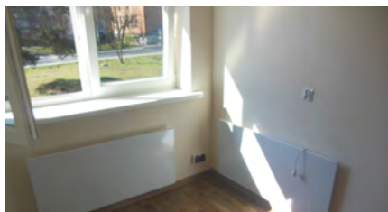
Wyremontowane mieszkanie w budynku socjalnym przy ul. Tysiąclecia 53

Setki tysięcy złotych z tzw. funduszu alkoholowego co roku są przeznaczone na remonty mieszkań socjalnych. W tym roku Gmina zaplanowała odnowienie dziewięciu lokali w różnych częściach miasta. To konieczne inwestycje – mieszkania zwalniane przez najemców często wymagają kompleksowego remontu, zanim trafią do kolejnych osób z listy.